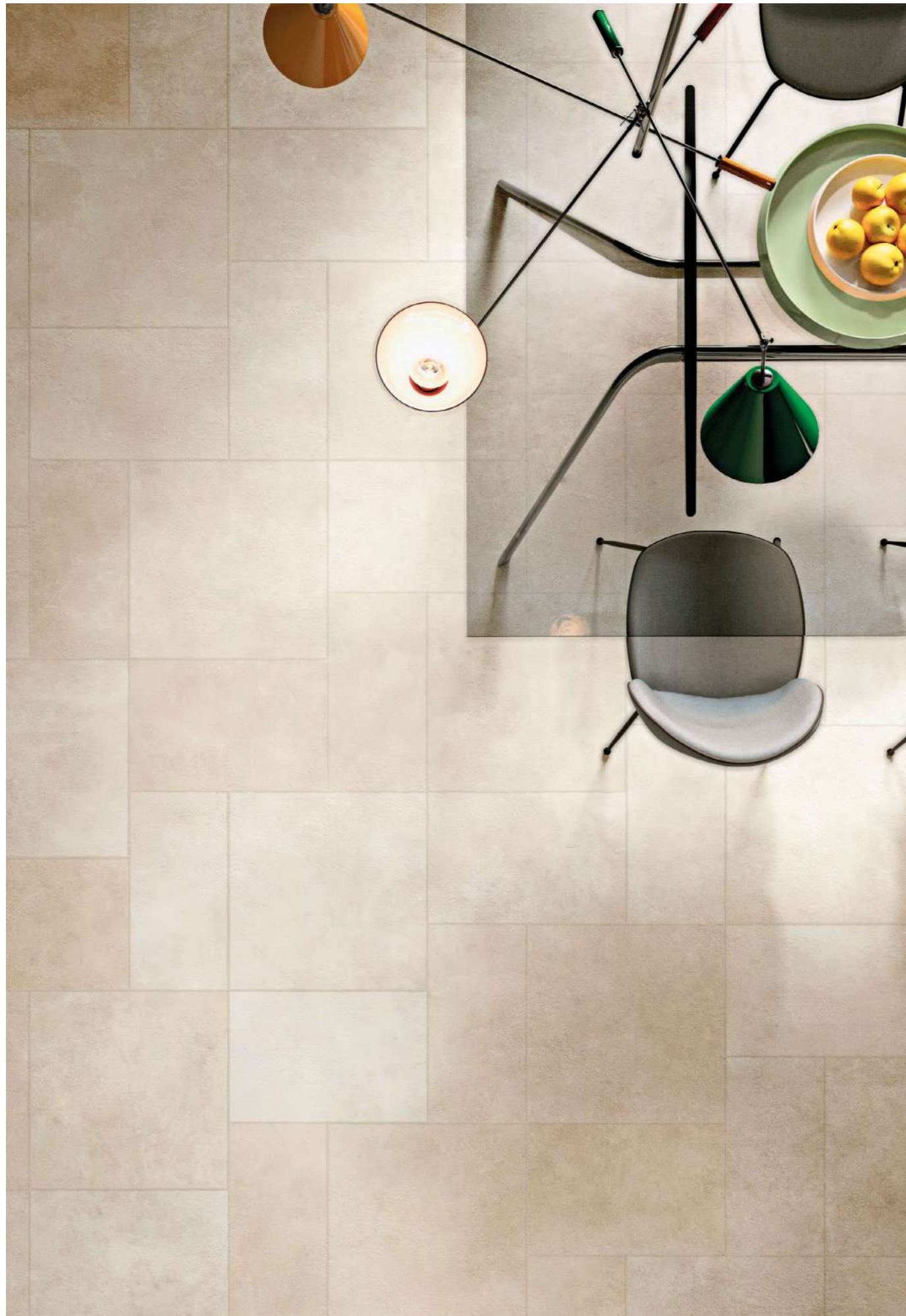
Levante Naturale 30x60-40x60-60x60