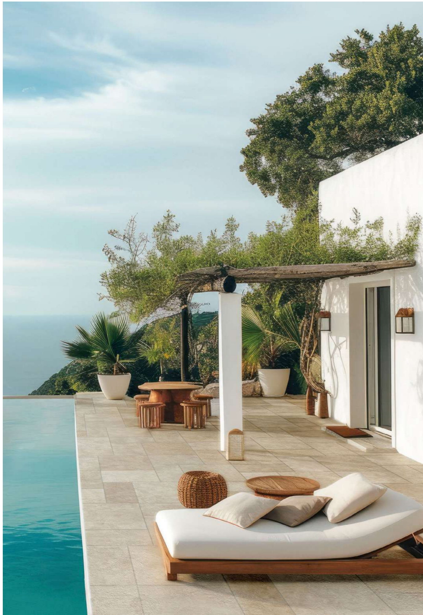
Levante Naturale 30x60-40x60-60x60 Antislip R11