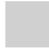
60x60 Bordo Irregolare

Caratteristiche Tecniche • Technical Features • Caractéristiques Techniques • Technische Eigenschaften